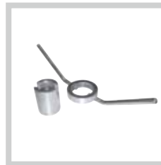
Spannmutter Clamping fixture Écrou de serrage