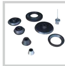
Konen Cone Cônes