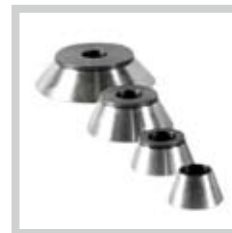
Konen Cone Cônes