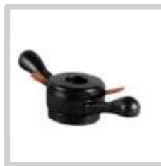
Schnellspannmutter Quick nut Tuerca de fijación rápida