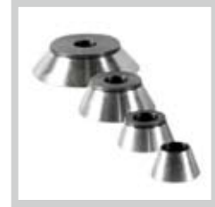
Konen Cone Conos