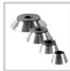
Kone Cone Conos